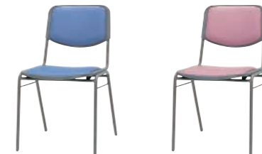
LB(ライトブルー) PN(ピンク)

DC-45V-□ ¥11,025(10,500) W450×D524×H750 SH430%