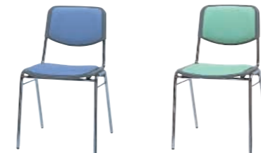
LB(ライトブルー) LM(ライトグリーン)

DC-45MV-□ ¥12,600(12,000) W450×D524×H750 SH430%