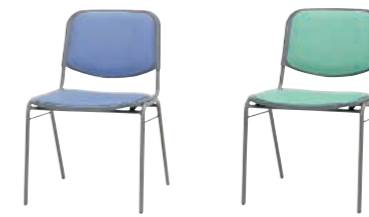
LB(ライトブルー) LM(ライトグリーン)

DC-50V-□ ¥13,755(13,100) W500×D530×H750 SH430%