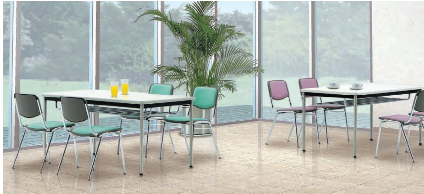
セット写真のテーブル MTS-15751MMG(ニューグレー)、チェア DC-45MV-LM(ライトグリーン)・DC-45MV-PN(ピンク)