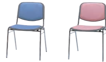
LB(ライトブルー) PN(ピンク)

DC-50MV-□ ¥15,435(14,700) W500×D530×H750 SH430%