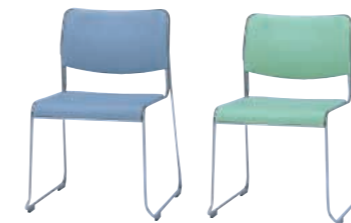
LB(ライトブルー) LM(ライトグリーン)

SC-510V-□ ¥21,105(20,100) W500×D520×H755 SH430%