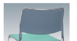
背・座/P.P.樹脂成形品

専用台車に30脚積載可能 専用台車 SCD-30 P228 ¥40,320(38,400) W500×D750×H630% ●梱包2台入