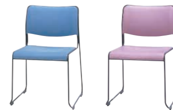
LB(ライトブルー) PN(ピンク)

HC-710V-□ ¥12,390(11,800) W500×D520×H755 SH430%