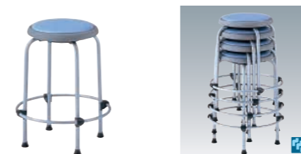
B(ブルー) 平積み6脚可能